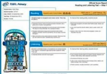
Phiếu điểm TOEFL PRIMARY